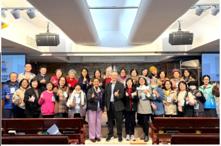
亞東基礎志工訓練 活動剪影 (攝於 2026.01.28)

郵政劃撥: 劃撥帳號: 19435507 戶名: 貴格會板城教會 統一編號: 04852591 財團法人台北市基督教台灣貴格會 地址: 22060 新北市板橋區南雅南路二段 142 巷 2 號 B1 交通: 捷運板南線-亞東醫院站 2 號出口 電話: (02)8966-0446、(02)8967-0447 傳真: (02)8966-7649