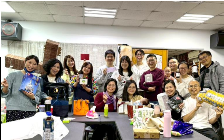
寶貝夫妻交換禮物 活動剪影 (攝於 2025.12.28)

郵政劃撥：劃撥帳號：19435507 戶 名：貴格會板城教會 統一編號：04852591 財團法人台北市基督教台灣貴格會 地 址：22060 新北市板橋區南雅南路二段 142 巷 2 號 B1 交 通：捷運板南線-亞東醫院站 2 號出口 電話：(02)8966-0446、(02)8967-0447 傳真：(02)8966-7649