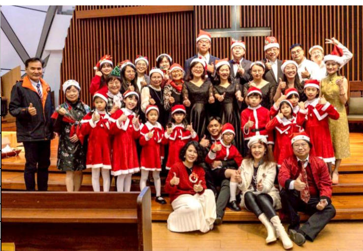
小蜜滴小詩班雙連安養院服事 活動剪影 (攝於 2025.12.14)

郵政劃撥: 劃撥帳號: 19435507 戶 名: 貴格會板城教會 統一編號: 04852591 財團法人台北市基督教台灣貴格會 地 址: 22060 新北市板橋區南雅南路二段 142 巷 2 號 B1 交 通: 捷運板南線-亞東醫院站 2 號出口 電話: (02)8966-0446、(02)8967-0447 傳真: (02)8966-7649