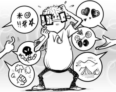
與智慧人同行的必得智慧，和惡昧人做伴的必受虧損。(箴十三20)