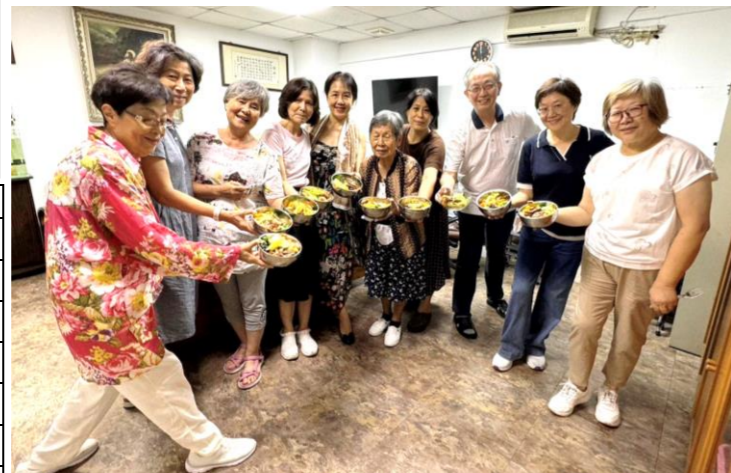
夏威夷拌飯試做團隊 活動剪影 (攝於 2024.07.04)

郵政劃撥: 劃撥帳號: 19435507 戶名: 貴格會板城教會 統一編號: 04852591 財團法人台北市基督教台灣貴格會 地址: 22060 新北市板橋區南雅南路二段 142 巷 2 號 B1 交通: 捷運板南線-亞東醫院站 2 號出口 電話: (02)8966-0446、(02)8967-0447 傳真: (02)8966-7649