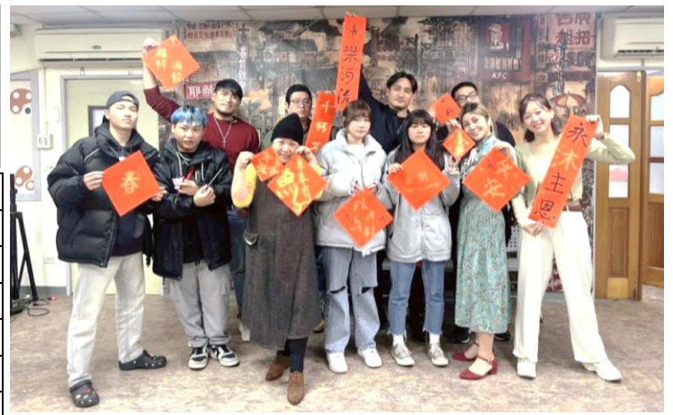
喜樂河小組寫春聯 活動剪影 (攝於 2024.1.28)

郵政劃撥: 劃撥帳號: 19435507 戶名: 貴格會板城教會 統一編號: 04852591 財團法人台北市基督教台灣貴格會 地址: 22060 新北市板橋區南雅南路二段 142 巷 2 號 B1 交通: 捷運板南線-亞東醫院站 2 號出口 電話: (02)8966-0446、(02)8967-0447 傳真: (02)8966-7649