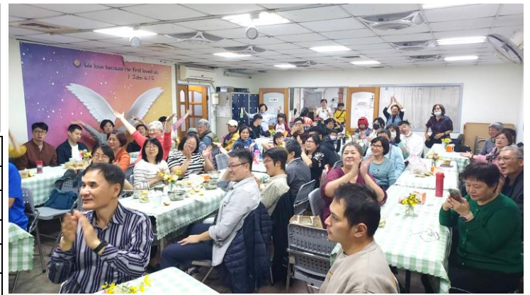
小羊.以斯拉.麥子聯合感恩聚會 活動剪影 (攝於 2023.11.21)

郵政劃撥: 劃撥帳號: 19435507 戶名: 貴格會板城教會 統一編號: 04852591 財團法人台北市基督教台灣貴格會 地址: 22060 新北市板橋區南雅南路二段 142 巷 2 號 B1 交通: 捷運板南線-亞東醫院站 2 號出口 電話: (02)8966-0446、(02)8967-0447 傳真: (02)8966-7649