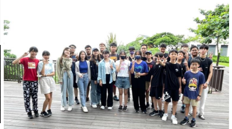
學牧迎新送舊 活動剪影 (攝於 2023.08.19)

郵政劃撥: 劃撥帳號: 19435507 戶名: 貴格會板城教會 統一編號: 04852591 財團法人台北市基督教台灣貴格會 地址: 22060 新北市板橋區南雅南路二段 142 巷 2 號 B1 交通: 捷運板南線-亞東醫院站 2 號出口 電話: (02)8966-0446、(02)8967-0447 傳真: (02)8966-7649