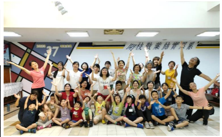
音動力一日營 活動剪影 (攝於 2023.08.12)

郵政劃撥: 劃撥帳號: 19435507 戶名: 貴格會板城教會 統一編號: 04852591 財團法人台北市基督教台灣貴格會 地址: 22060 新北市板橋區南雅南路二段 142 巷 2 號 B1 交通: 捷運板南線-亞東醫院站 2 號出口 電話: (02)8966-0446、(02)8967-0447 傳真: (02)8966-7649