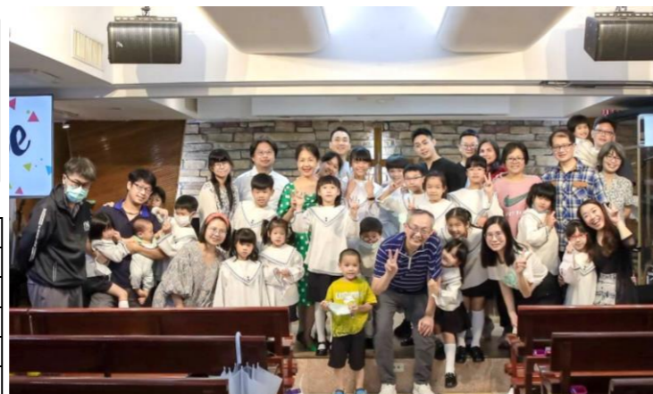
小蜜滴合唱團結業式 活動剪影 (攝於 2023.06.03)

郵政劃撥: 劃撥帳號: 19435507 戶名: 貴格會板城教會 統一編號: 04852591 財團法人台北市基督教台灣貴格會 地址: 22060 新北市板橋區南雅南路二段 142 巷 2 號 B1 交通: 捷運板南線-亞東醫院站 2 號出口 電話: (02)8966-0446、(02)8967-0447 傳真: (02)8966-7649