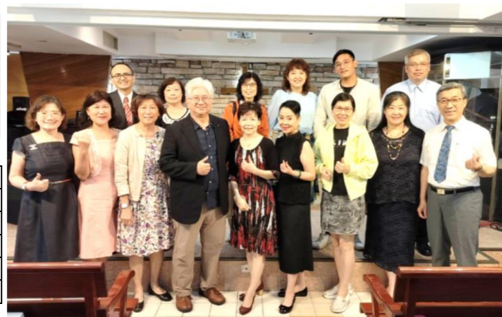
第三週名人講座 活動剪影 (攝於 2023.05.21)

郵政劃撥: 劃撥帳號: 19435507 戶名: 貴格會板城教會 統一編號: 04852591 財團法人台北市基督教台灣貴格會 地址: 22060 新北市板橋區南雅南路二段 142 巷 2 號 B1 交通: 捷運板南線-亞東醫院站 2 號出口 電話: (02)8966-0446、(02)8967-0447 傳真: (02)8966-7649