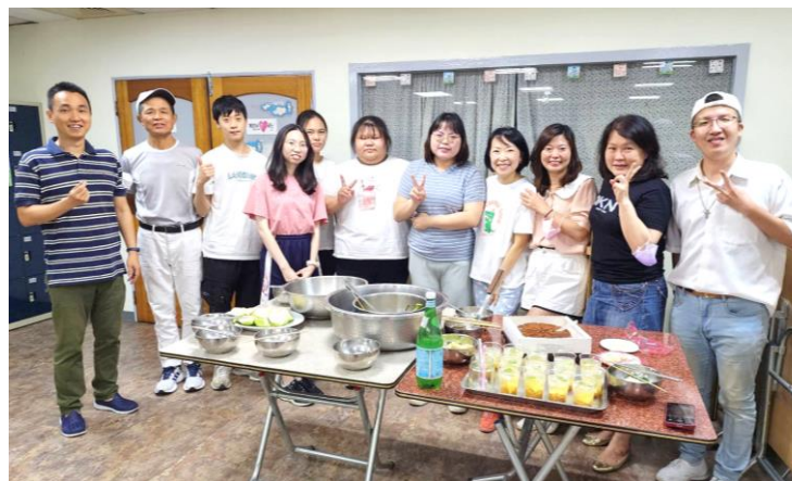
亞東韓文班 活動剪影 (攝於 2023.05.18)

郵政劃撥: 劃撥帳號: 19435507 戶名: 貴格會板城教會 統一編號: 04852591 財團法人台北市基督教台灣貴格會 地址: 22060 新北市板橋區南雅南路二段 142 巷 2 號 B1 交通: 捷運板南線-亞東醫院站 2 號出口 電話: (02)8966-0446、(02)8967-0447 傳真: (02)8966-7649